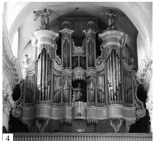
40 pvz. Nicolauso Jantzono vargonai: [1] Linkuvos (1764–1765); [2] Tytuvėnų (1789); [3] Vilniaus bernardinų (1764–1766); [4] Troškūnų (1787–1789) bažnyčiose