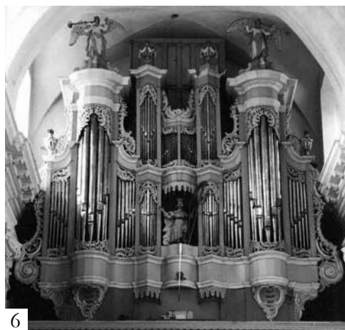
71 pvz. Prospekto architektūros kaita Nicolausui Jantzoniui priskiriamuose vargonuose: [1] Vilniaus bernardinų, [2] Linkuvos, [3] Budslavo (Baltarusija), [4] Vilniaus arkikatedros (rekonstruotas autentiškas prospektas), [5] Tytuvėnų, [6] Troškūnų bažnyčiose