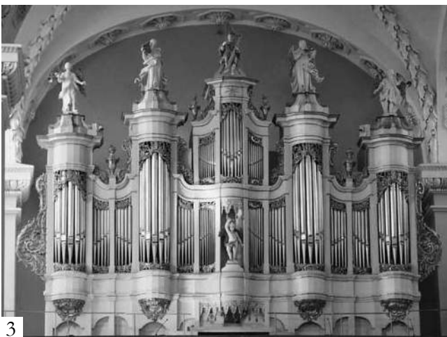
76 pvz. Vilniaus arkikatedros vargonai: [1] rekonstruota autentiška prospekto struktūra; [2] prospektas po pirmojo vargonų perstatymo 1857 m.; [3] dabartinis prospektas po antrojo vargonų per- statymo 1888–1889 m.