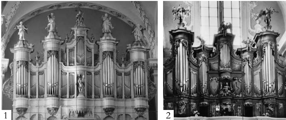
77 pvz. [1] Vilniaus arkikatedros vargonai po rekonstrukcijos 1888–1889 m.; [2] Casparini vargonai Vilniaus Šv. Dvasios bažnyčioje