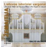
VPC 002, 2015